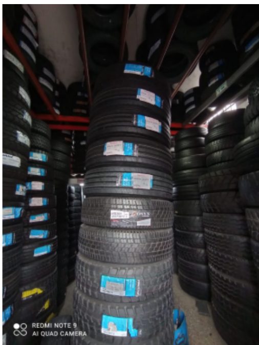
Foto 2. Vista General Del Acopio de Llantas.