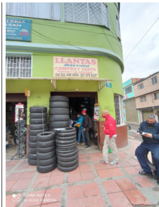
Foto 1. Vista General Del Establecimiento